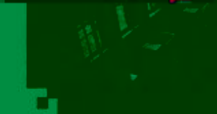
CNC 数控技术 训练场所